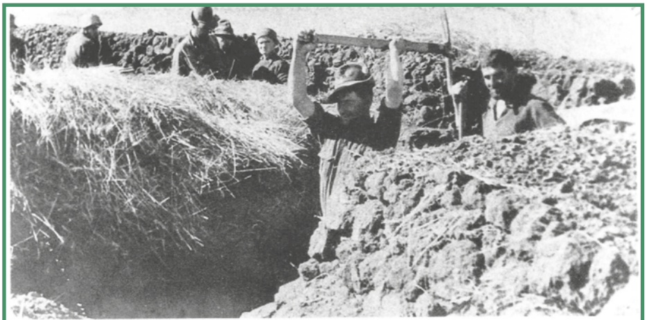
Autunno 1942, linea sul Don: si scavano trincee a colpi di piccone

Ho voluto riportare queste bellissime parole sulla definizione del nostro Cappello, Cappello che gli alpini hanno fieramente indossato durante la prima guerra mondiale, durante la ritirata di Russia, dopo la battaglia di Novo Postojalowka e che hanno portato in testa durante tutte le adunate nazionali, a cominciare dalla prima sull’Ortigara davanti alla Colonna Mozza.