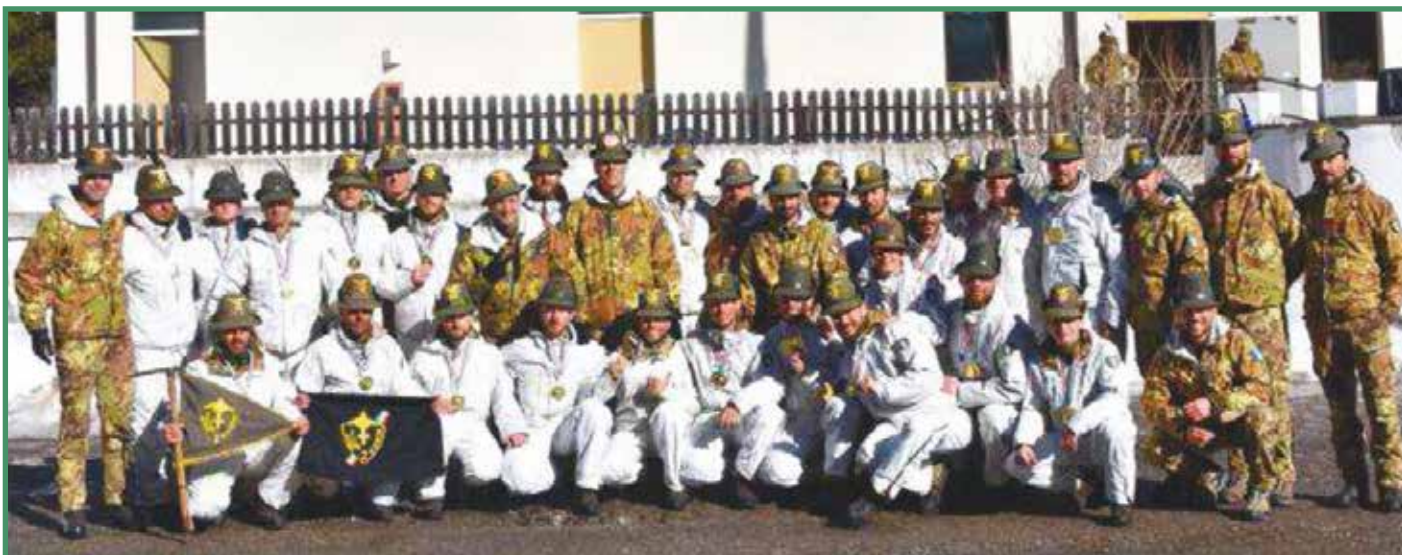
Il plotone del 2° Reggimento alpini, vincitori del trofeo Buffa

la collettività, con le proprie squadre di soccorso alpino militare presente in tutto l'arco alpino e nel Centro Italia. Trattamento del ferito in ambiente non permissivo, ricerche di travolti da